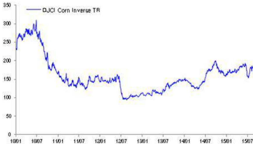
인버스 옥수수 지수