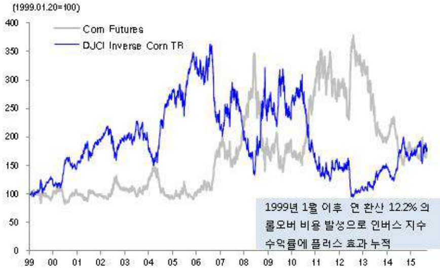
인버스 옥수수 지수 롤오버