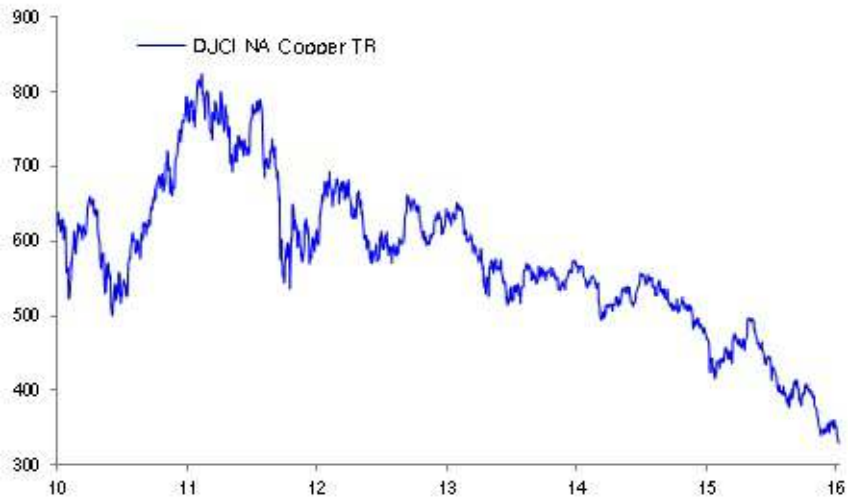
djci na copper tr