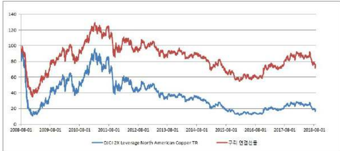
DJCI 2X Leverage North American Copper TR